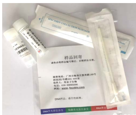
RNA 样本粪便标本收集管（左下），漱口液收集管（右下）